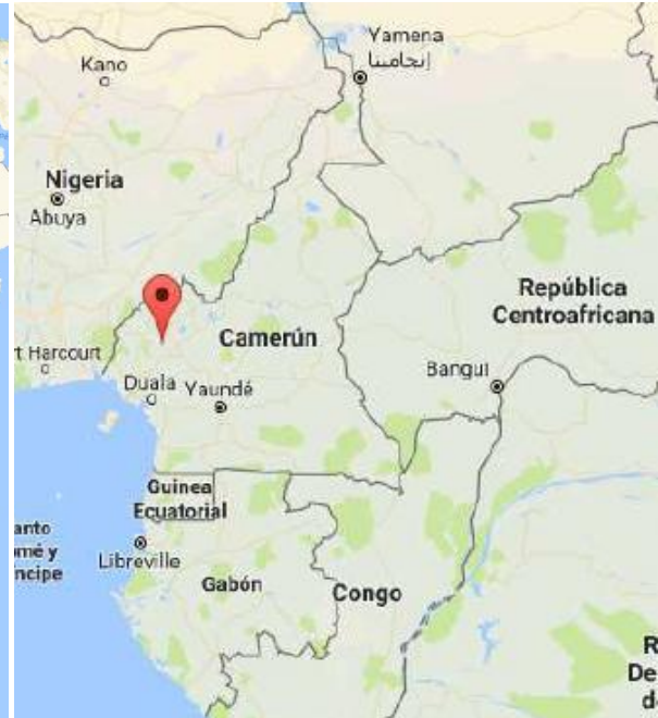
Ilustración 1: Mapa Camerún. Fuente: Google Maps