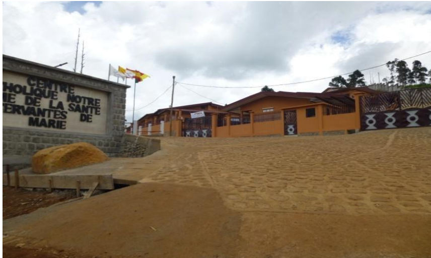
Ilustración 4: Entrada a Notre Dame de la Santé.