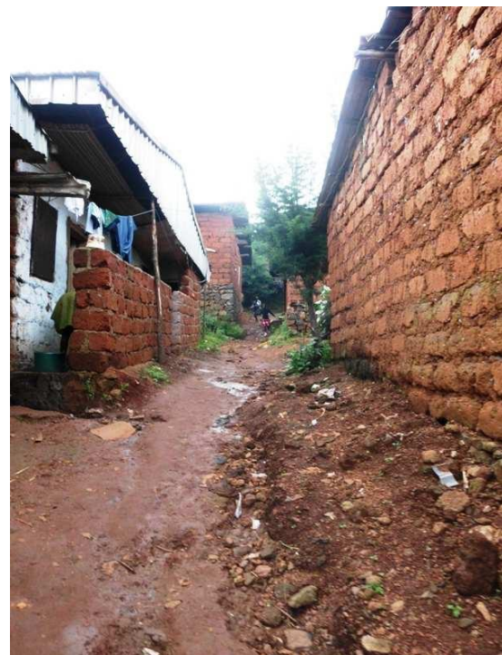
Ilustración 7: Periferia de la ciudad de Dschang.