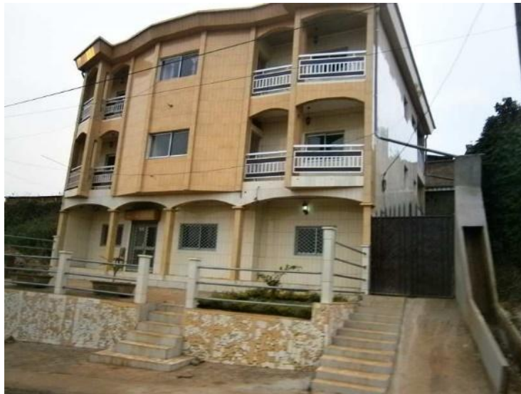
Ilustración 6: Edificio de viviendas en la ciudad de Dschang.

Los habitantes de las villas suman un total de 25.330 habitantes, que añadidos a los 20.000 de Batseng'la alcanzan un total de 45.330 beneficiarios dentro de la zona de actuación.