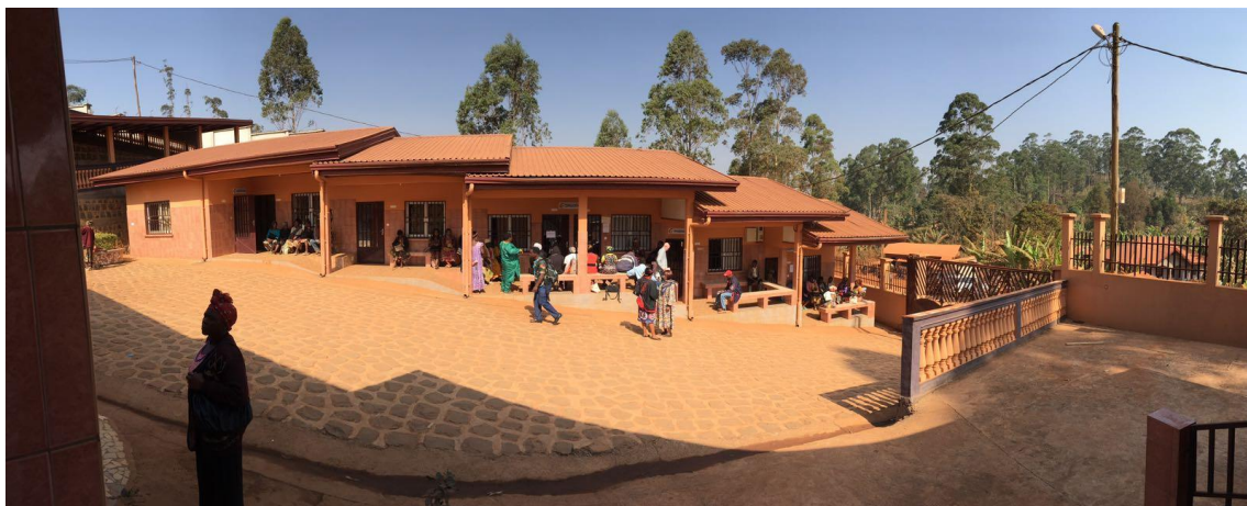
Ilustración 3: Vista panorámica del ala de consultas del Centro de Salud Notre Dame de la Santé.

El Centro de Salud cuenta con 100 camas de hospitalización, cuatro salas de consultas externas, dos quirófanos, paritorio, laboratorio, sala de rayos, farmacia hospitalaria, sala de rehabilitación, cantina y capilla.