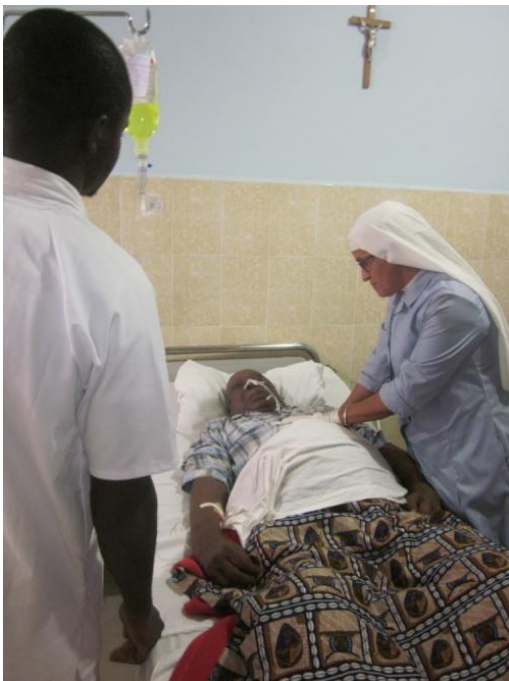
Ilustración 9: Paciente atendido en Notre Dame de la Santé.

La Congregación de las Siervas de María se encuentra presente en Camerún desde el año 1971 y actualmente cuenta con tres centros medicalizados, en los que se tiene como objetivo brindar una asistencia sanitaria digna, humana y profesional a los pacientes, así