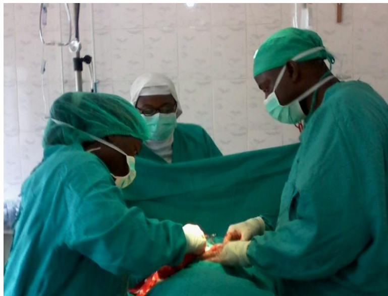
Ilustración 5: Quirófano en Notre Dame de la Santé.